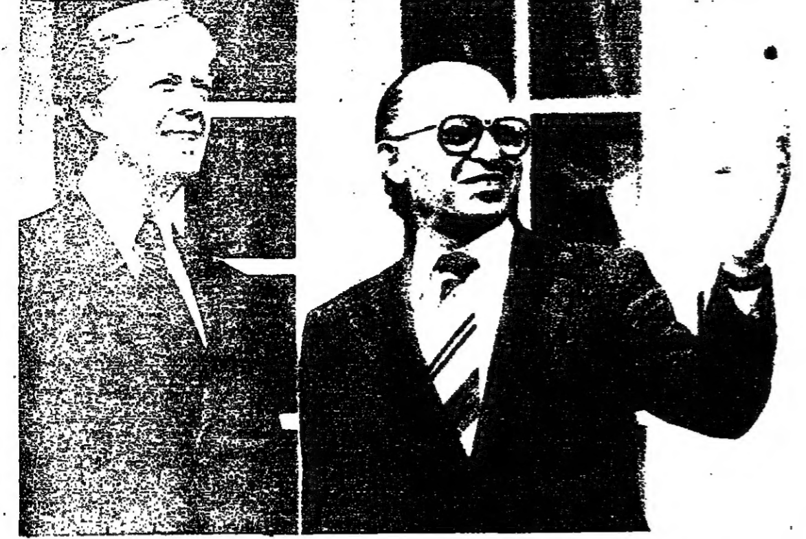
الرئيس الإسرائيلي جيمي كارتر يستقبل السيد منحيم بيغن في حديقة الورود في البيت الأبيض قبل انعقاد الجولة الأولى من المحادثات .

واشنطن - اقترح السيناتور بيغن رئيس الوزراء على الرئيس الاميركي جيمي كارتر خلال محادثتهما هنا امس ان تجري محادثات الحكم الإداري الذاتي في الضفة الغربية وقطاع غزة بصورة مكثفة لمدة اربعين يوماً ابتداء من اليوم ، وعلم ان السيد بيغن اقترح ان تبدأ المحادثات في الاسكندرية لمدة عشرين يوماً وان تواصل في تل ابيب حتى الموعد المحدد لانجاز ما في السادس والعشرين من شهر ايار القادم . واكدت مصادر مطلعة هنا ان السيد بيغن تحفظ بذلك من الاقتراح الاميركي الداعي الى عقد هذه المحادثات في واشنطن وتكررت الاتهام ان الرئيس الاميركي اطلع الرئيس المصري محمد انور السادات على اقتراح رئيس الوزراء لمعرفة رايه واتخاذ الخطوات اللازمة للشروع في تنفيذ هذا الموضوع .